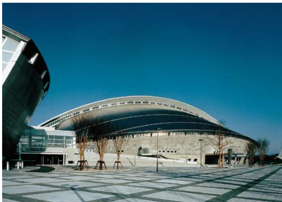
宮城県総合運動公園総合体育館