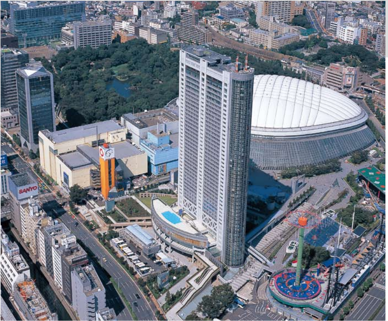
東京ドームホテル